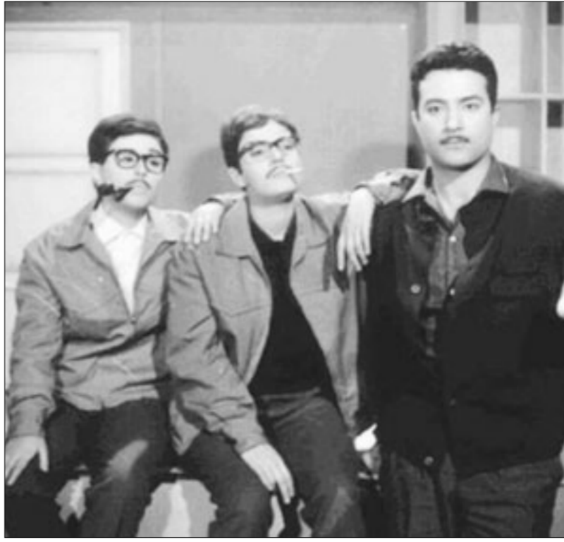
من فيلم للرجال فقط