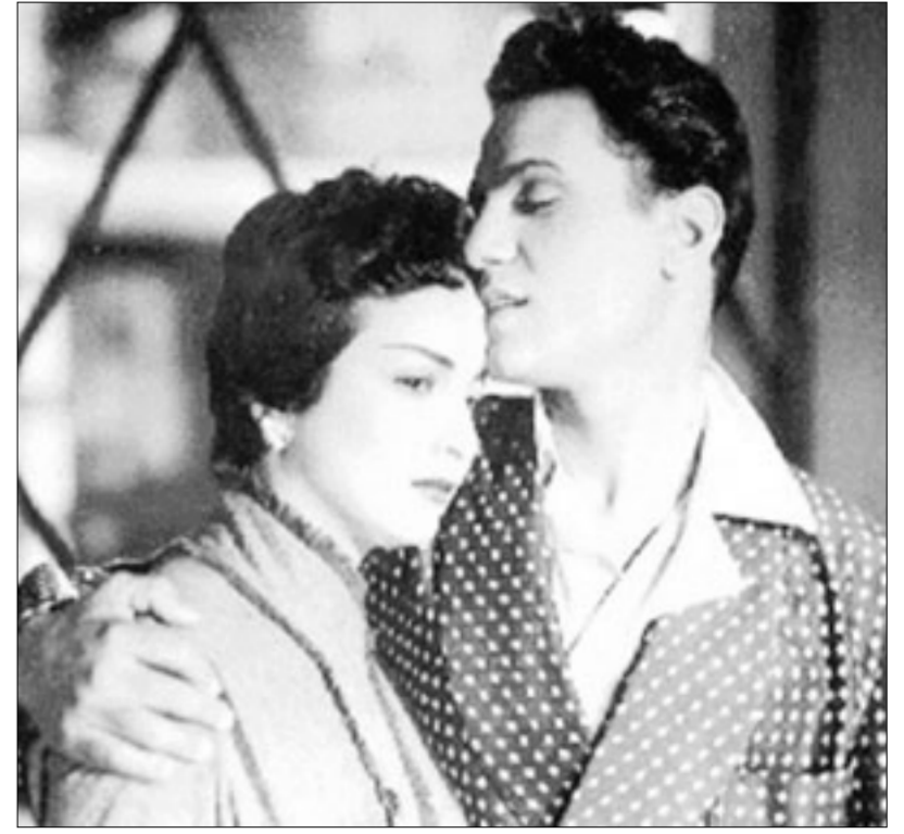
من فيلم لحن الوفاء