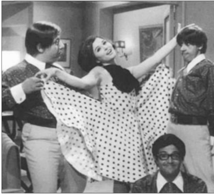
من فيلم شباب مجنون جداً