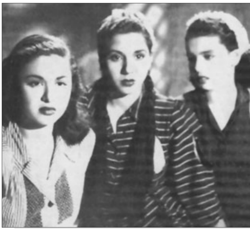
من فيلم أنا بنت ناس

أنتذكر جيداً.. كيف أننا مع طول هذا المشوار.. أقصد ذلك الطريق الذي يمتد من بيتنا في فريق الحياك.. إلى كازينو المحرق.. وحتى السينما مشياً على الأقدام.. كنا نستمتع بالحديث والتندر في استذكار أفلام سابقة شاهدناها سوياً.. حتى أننا كنا نتحدث عن كيف سيكون الفيلم الذي سنشاهده مع عدم معرفتنا