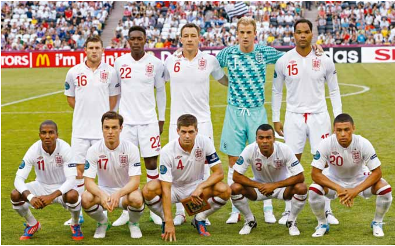
منتخب إنجلترا لكرة القدم