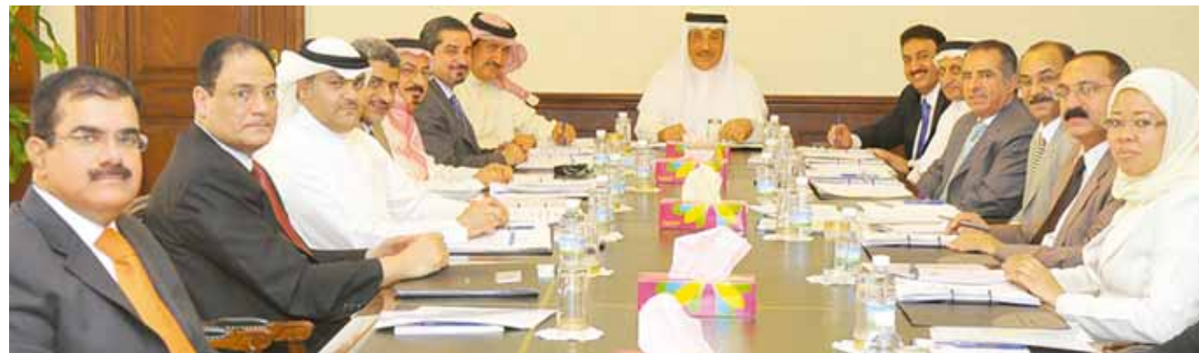
○ حميدان يترأس اجتماع المجلس الأعلى للتدريب المهني.

أكد وزير العمل السيد جميل بن محمد علي حميدان، رئيس المجلس الأعلى للتدريب المهني، أن التدريب الفني والحرفي للقوى العاملة البحرينية في القطاع الصناعي وتأهيل الباحثين عن عمل للانخراط فيه يشكل دعماً أساسياً للتنمية الصناعية في مملكة البحرين، معتبراً أن الاهتمام بالبرامج التدريبية في هذا القطاع الحيوي سيخلق كادراً وطنياً يساهم بفعالية في دفع التنمية الصناعية في البلاد من خلال تهيئة وتأهيل المزيد من العناصر الوطنية التي أثبتت كفاءتها وقدرتها على إدارة وتشغيل المنشآت الصناعية في هذا القطاع.