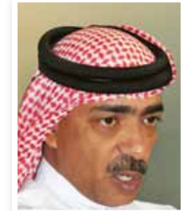
الشيخ علي بن محمد

أكد الشيخ علي بن محمد آل خليفة رئيس الاتحاد العربي لكرة الطائرة أن الاتحاد الدولي لكرة الطائرة على موقعه الإلكتروني مؤخراً خبر استضافة الاتحاد العربي على هامش اجتماعه بالمنامة ثلاثي مرشحي الاتحاد الدولي للعبة الأسترالي والبرازيلي والأميركي وأن سكرتارية الاتحاد البحريني قامت بإرسال بعض الصور الخاصة بالاستضافة إلى موقع الاتحاد الدولي هذا الأخير الذي قام بدور صياغة الخبر على موقعه، وكان الاتحاد العربي قد استقبل مؤخراً مرشحي الاتحاد الدولي لاستعراض برامجهم للفترة الانتخابية القادمة كرسالة للمرشحين ليكونوا على دراية بأن الاتحاد العربي يمثل منظومة رياضية لها ثقلها على خريطة