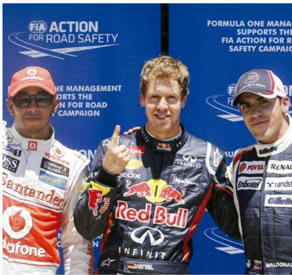
○ سيباستيان فيتل ينطلق أولاً اليوم

وأكد المدرب: «انني سعيد للغاية وفخور بهذه المجموعة من اللاعبين، بعيداً عما ستسفر عنه مباراتنا كورينثيانز في نهائي كأس ليبرتادوريس، أو راسينج في نهائي كأس الأرجنتين، أو الجولة الأخيرة من كلاوسورا اليوم»، وأكد فالنتشوني أنه سيدفع بفريق قوامه من البدلاء أمام أول بوينس آيرس، حيث باتت الأولوية الآن لمواجهة كورينثيانز، حيث تقام مباراة الذهاب لنهايي البطولة القارية الأربعاء المقبل في بوينس آيرس.