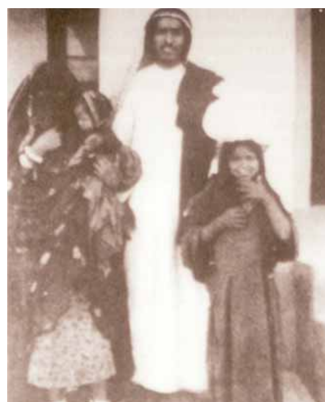
○ أحد المرضى لدى خروجه من المستشفى.