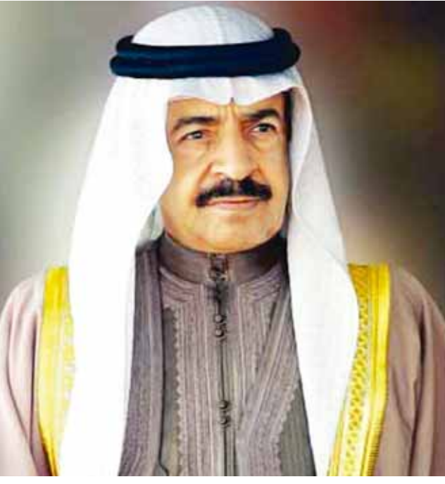
O سمو رئيس الوزراء.

سمو رئيس الوزراء دليل حرص سموه على توفير كل ما يحتاج إليه المواطن من خدمات حتى الترفيهية منها. وأضاف بوعنق ان المشروع سيستخدم أهالي المحرق بالخصوص والبحرين عامة بشكل كبير وخصوصاً ان ٦٠٪ من المشروع سيكون عامماً للجميع و ٤٠٪ المستثمر والمستثمر سيقدّم العديد من الخدمات التي تحتاجها محافظة المحرق.