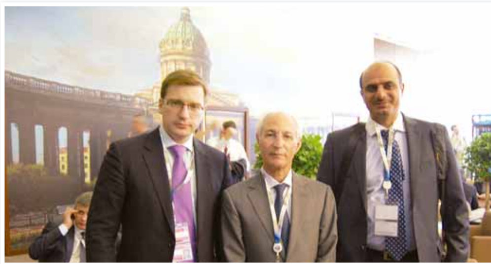
O سفير البحرين في موسكو خلال المنتدى.

وكبار المسؤولين ورجال المال والأعمال من بعض الدول العربية والأجنبية، إضافة إلى حشد كبير من ممثلي وسائل الإعلام الروسية والعالمية. وقد عدد المشاركين في هذا المنتدى بحوالي ٥٠٠٠ مندوب يمثلون أكثر من ٥٠ بلداً في العالم. وقد تخلل أعمال المنتدى طاولة حوار مفتوحة بين مسؤولين ورجال أعمال عرب وروس حيث أبدى الطرفان تفاعلاً بنظور العلاقات الاقتصادية العربية الروسية.