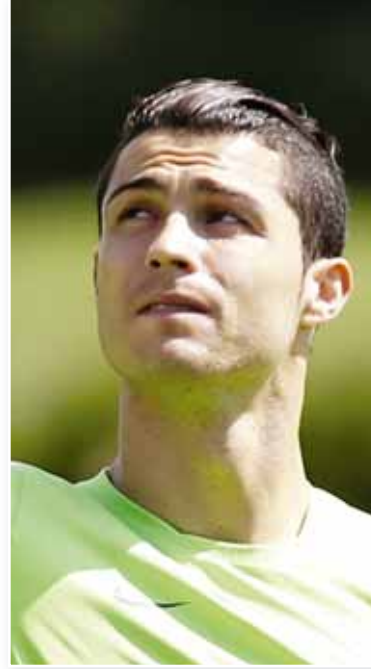
○ كريستيانو رونالدو

والرسو - د ب أ: لا يوجد مكان للوافدين الجدد في يورو ٢٠١٢، حيث احتل النجوم الكبار العناوين الرئيسية لوسائل الإعلام، كريستيانو رونالدو قائد المنتخب البرتغالي إلى المربع الذهبي، واين روني أهدى ربييري ظهر ككائد للديوك الفرنسية، قبل عامين في كأس العالم بجنوب إفريقيا، قائد توماس مولر بعض الصبية في صفوف المنتخب الألماني لنيل شهرة واسعة بعدما تصدر قائمة هدافي المونديال.