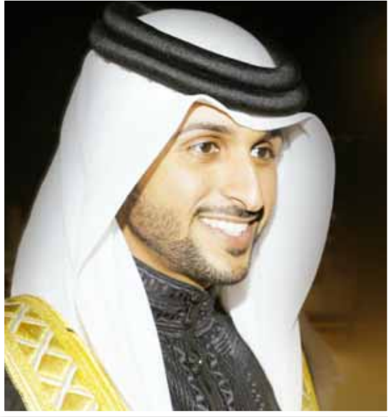
○ سمو الشيخ ناصر بن حمد آل خليفة