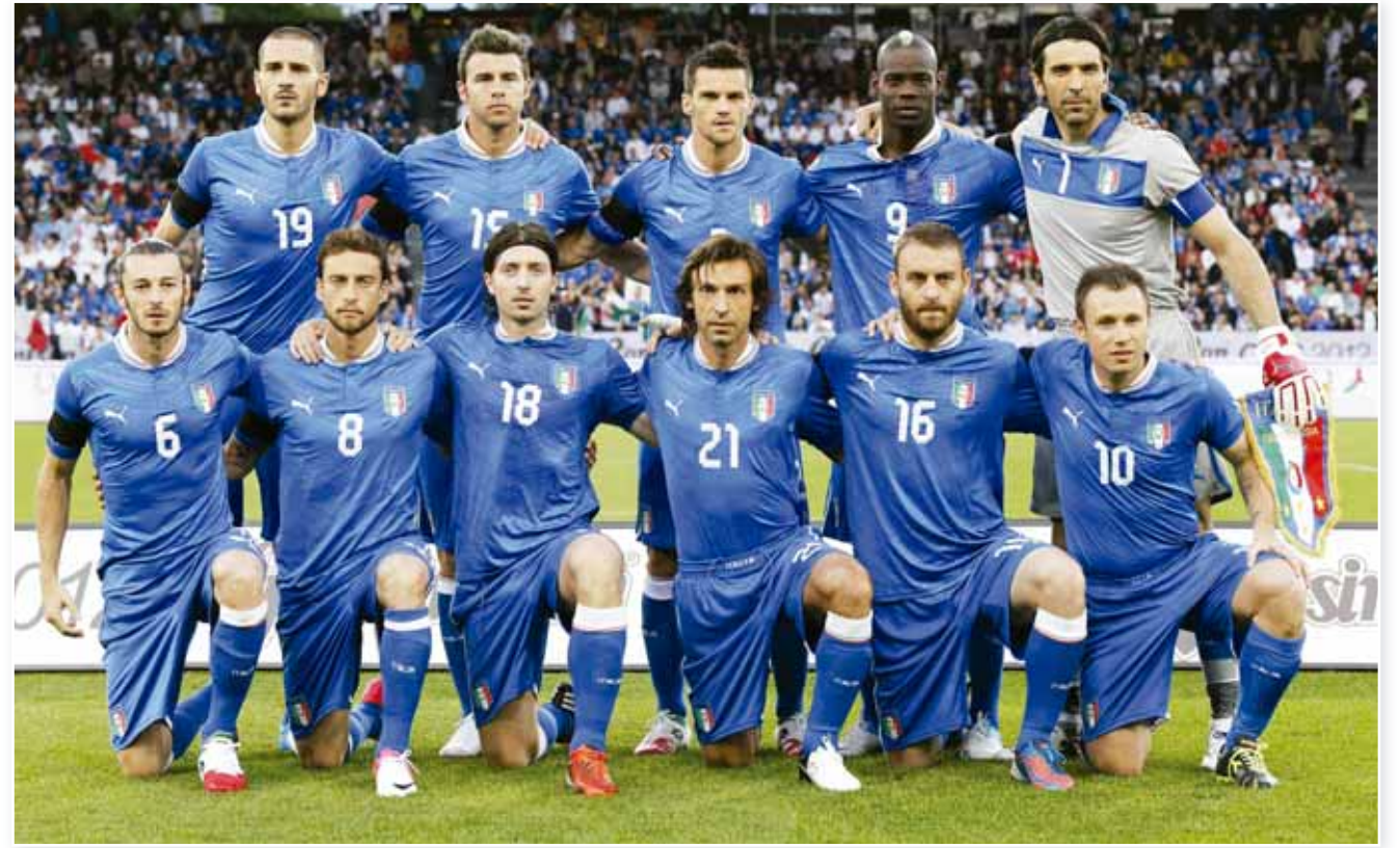
منتخب إيطاليا لكرة القدم