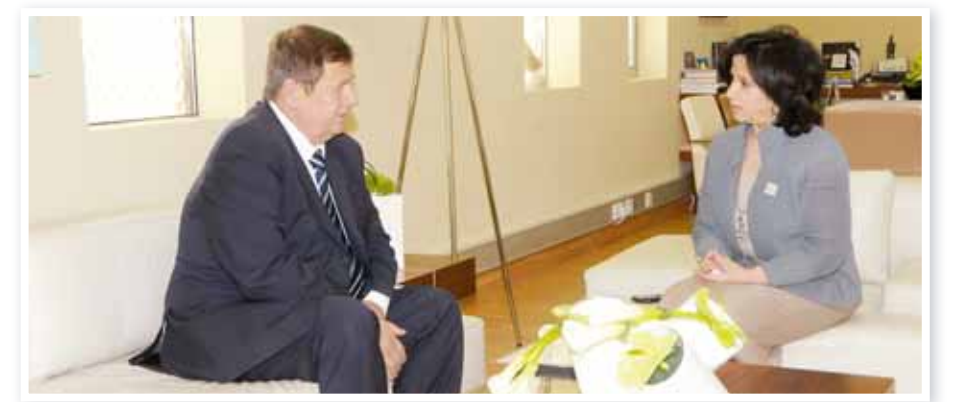
O وزيرة الثقافة خلال لقائها السفير الروسي.

تفتح سفارة خادم الحرمين الشريفين لدى مملكة البحرين أبوابها اعتبارا من يوم غد الإثنين لتسجيل المبايعة وتقبل التهانى بمناسبة الثقة الملكية السامية بتعيين صاحب السمو الملكي الأمير سلمان بن عبدالعزيز آل سعود وليا للعهد، وذلك في الساعة ٩:٠٠ صباحا وحتى ١٢:٠٠ ظهرا مدة أربعة أيام بمقر السفارة. وسيكون السفير الدكتور عبد المحسن بن فهد المارك وأعضاء السفارة في استقبال المهتمين والمبايعين.