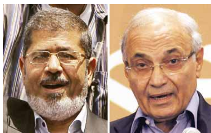
○ محمد مرسي