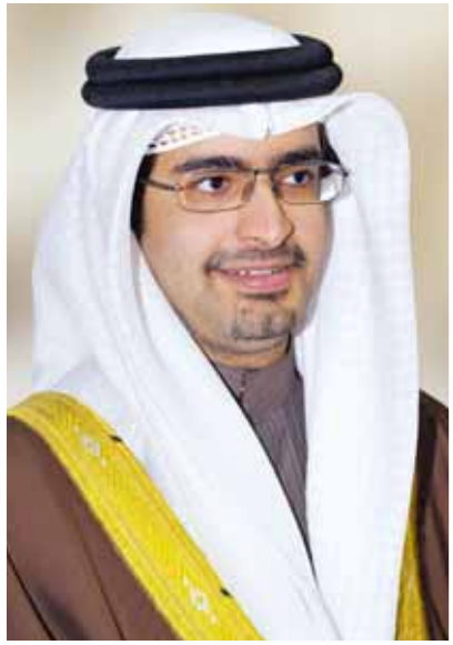
O سمو الشيخ خليفة بن علي.

تحت رعاية سمو الشيخ خليفة بن علي بن خليفة آل خليفة رئيس مجلس الأمناء لمشروع التبرع للجنة المنظمة لمشروع البر حفل تكريم المتفوقين لطلبة المرحلة الثانوية ٢٠١٢.