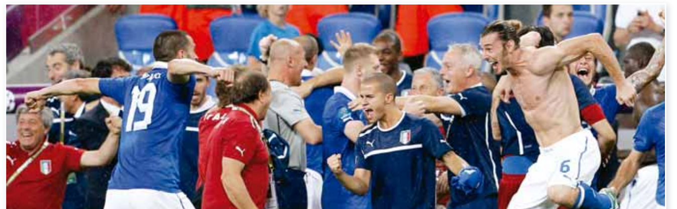
فرحة لاعبي المنتخب الإيطالي بالفوز على إيرلندا