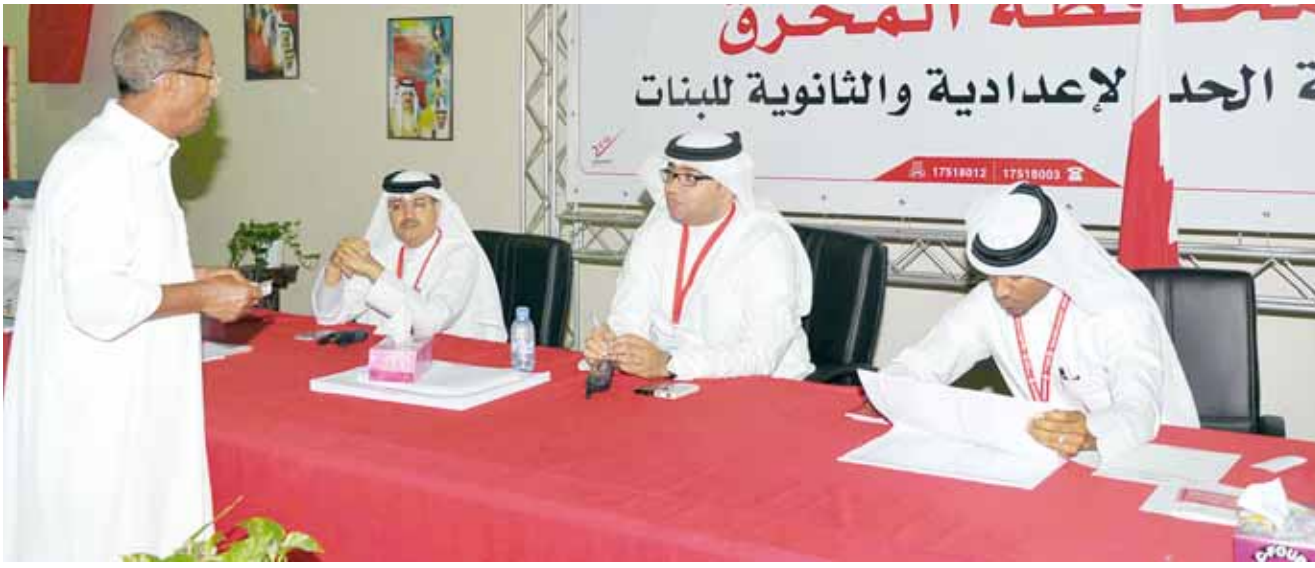
○ اللجنة المشرفة على الانتخابات.