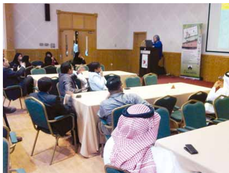
○ إحدى مؤتمرات جمعية الأطباء البحرينية.