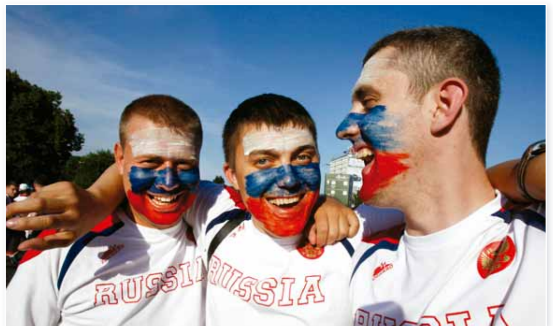
○ الجماهير الروسية في يورو ٢٠١٢

وارسو - أ ف ب: تواصلت مشاكل الاتحاد الروسي لكرة القدم مع نظيره الأوروبي بعد أن قرر الأخير يوم أمس فرض غرامة جديدة على الأول بسبب تصرفات جمهوره خلال كأس أوروبا ٢٠١٢ التي استضافها بولندا وأوكرانيا حتى الأول من الشهر المقبل، وغرم الاتحاد الروسي مبلغ ٣٥ ألف يورو بسبب شغب جمهور منتخبه خلال مباراته الأخيرة في الدور الأول من البطولة القارية أمام اليونان (صفر-١)، لترتفع قيمة الغرامات التي فرضها الاتحاد القاري على الروس إلى ١٨٥ ألف يورو نتيجة تصرفات الجمهور خلال كأس أوروبا التي ودعها المنتخب الروسي من الدور الأول.