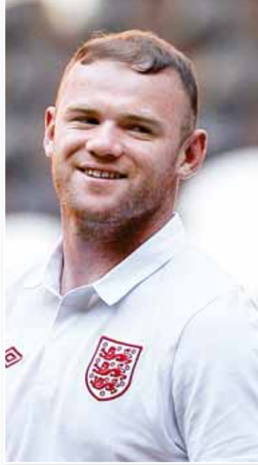
○ واين روني