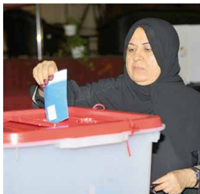
○ إقبال واسع من جميع الأعمار.