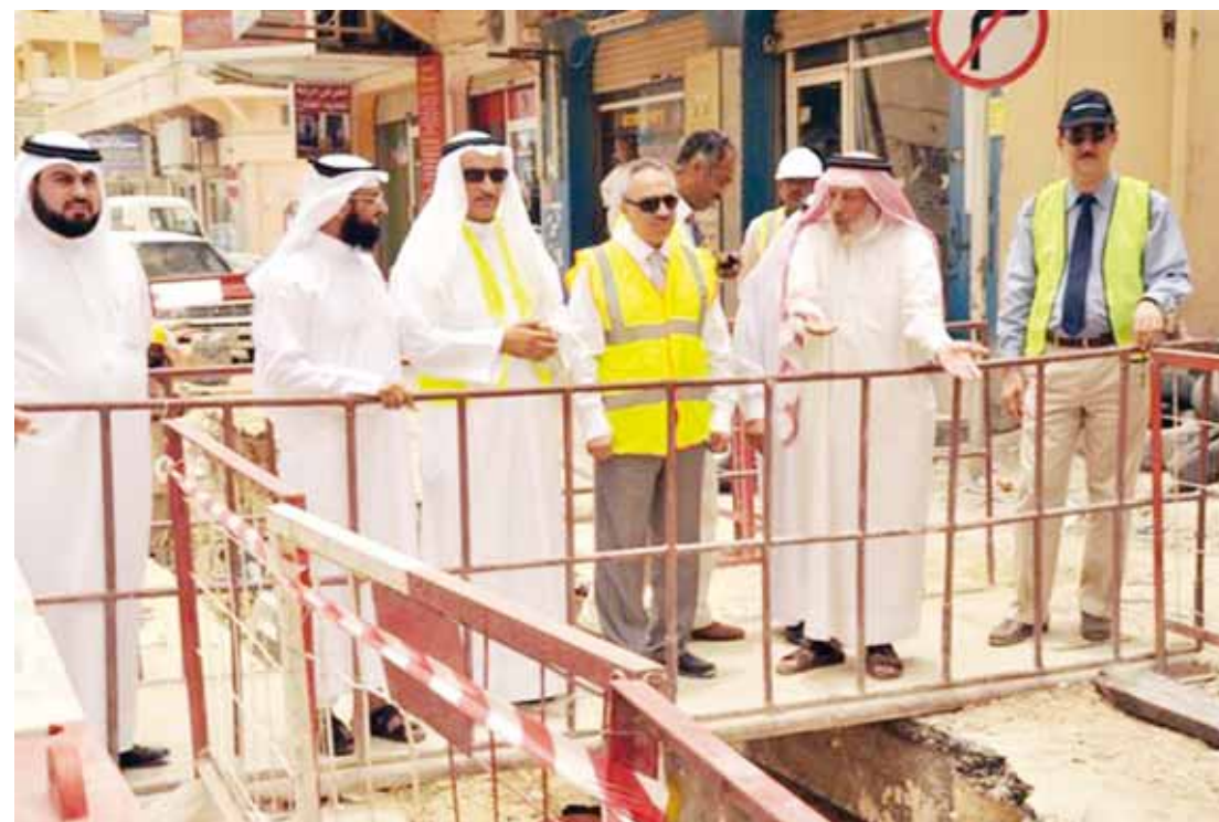
○ جولة وزير الأشغال.

ضمن توجيهات صاحب السمو الملكي الأمير خليفة بن سلمان آل خليفة رئيس الوزراء بالتعجيل بكل المشاريع التي ترتبط بالحياة اليومية للمواطنين ومتابعة مراحل تنفيذها، قام وزير الأشغال المهندس عصام بن عبد الله خلف بزيارة تفقدية لمشروع الصرف الصحي في الرفاع الشرقي (بمرحلة E6 - E7) يرافقه كل من وكيل الوزارة المهندس وليد الساعي، والكبير المساعد للصرف الصحي المهندس خليفة المنصور، مدير إدارة تخطيط ومشاريع الصرف الصحي المهندس أسماء جاسم مراد، مدير إدارة تشغيل وصيانة الصرف الصحي المهندس إبراهيم الحواج، رئيس قسم الإنشاءات المهندس داود خلف، السيد عبد الرزاق الحطاب رئيس المجلس البلدي الوسطي، السيد محسن البركي رئيس المجلس البلدي الجنوبي، السيد علي الأنصاري الخرجي مدير إدارة الخدمات وبرامج التنمية بالمحافظة الجنوبية وعدد من مهندسي واستشاريي المشروعين وممثلي المجالس البلدية.