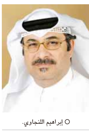
○ إبراهيم النجاي

رئيس الوزراء أحق الحق وأعاد الأمور في الغرفة إلى نصابها