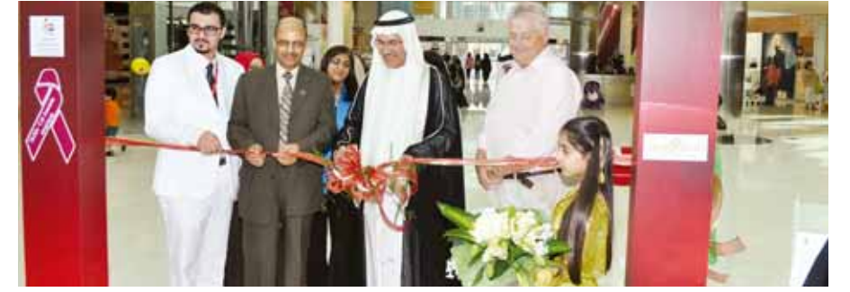
O نائب المحافظ يفتتح المعرض.

عبرت سفارة المملكة العربية السعودية بمملكة البحرين الشقيقة عن عميق شكرها وتقديرها وامتنانها لجميع الإخوة والأخوات الذين قدموا تعازيهم حضورياً أو خطياً أو هاتفياً في وفاة صاحب السمو الملكي الأمير نايف بن عبدالعزيز آل سعود ولي عهد المملكة العربية السعودية - تغداه الله بواسع رحمته ومغفرته - ولقد كان الشعور الكبير والمواساة الواسعة لهذا المصاب الأليم من قبل مملكة البحرين الشقيقة قيادة وشعباً كبيرة ومتدفقة ومفعمة بالعواطف الصادقة المخلصة والتي تعكس مدى العلاقات الممتازة والمميزة بين البلدين الشقيقين المملكة العربية السعودية ومملكة البحرين.