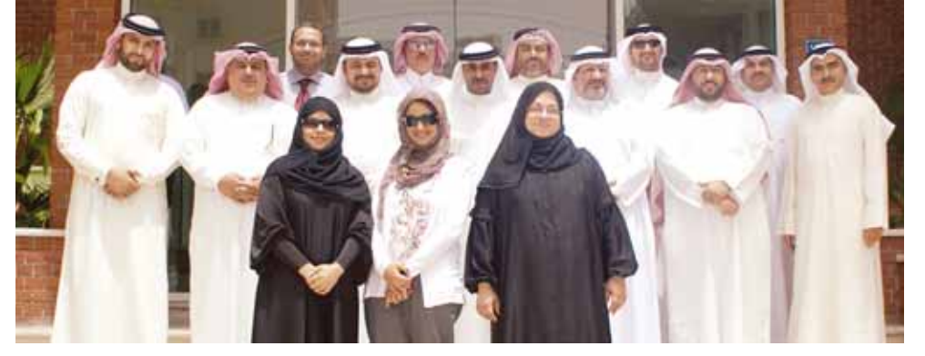
O المشاركين في الدورة.