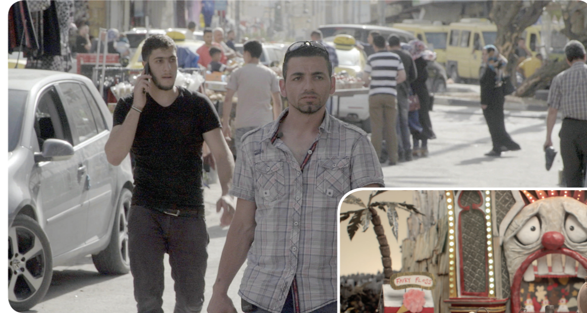
عطلات في فلسطين