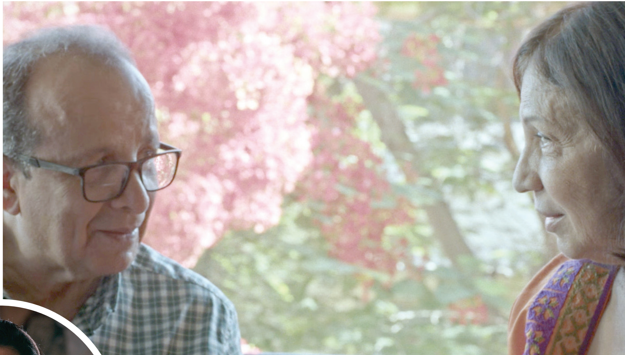
”جاء الربيع يضحك