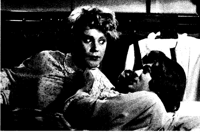
فيلم البعض يفضلونها ساخنة

فعلا جاك ليمون وتوني كيرتس في فيلم "البعض يفضلونها ساخنة" . فإذا كان مازال مصراً على رأيه، إستمر معه . أو إسأله بأن يطلب نصيحة طبيبه ومحاميه . إن الأمر يتوقف على مدى رغبتك في المقامرة .