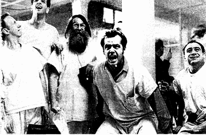
فيلم طار فوق عش المجانين

حواله . ومن المحتمل أن يكون كل ما تحتاج إليه هو حدث يبدو صغيراً - مثل إطفاء سيجارة أو إختيار ورقة كوتشينة أو إضاءة أو إطفاء الأنوار . المهم هو مجرد أن تدع المتفرجين يعرفون بطريقة ما أن الشخصية لها إتجاه .