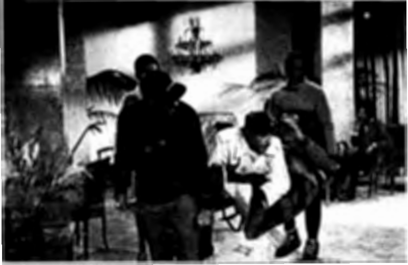
فيلم الفهد الوردي

الشاشة بقدر معقول ؟ أو بأنهم يجب أن يظهروا كثيراً من آن لآخر حتى يظل المتفرجون متيقظين لوجودهم ؟