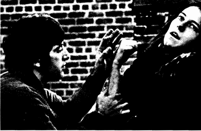
فيلم ذعر فى نيدل بارك

يفعل ماذا، ولماذا لا يقدر؟". أي الملخص الذي يعتمد على الهدف - العقبة - النتيجة . إن المهمة ليست بالغة الصعوبة، خاصة إذا كنت قد بنيت السيناريو متينا، خطوة وراء خطوة، على أساس قوي من فكرة أساسية أو توكيد للـب الموضوع . أما المهام التي لا شكل لها وغير المبنية على أساس سليم فهي المهام التي يمكنها أن تقضى عليك تماماً .