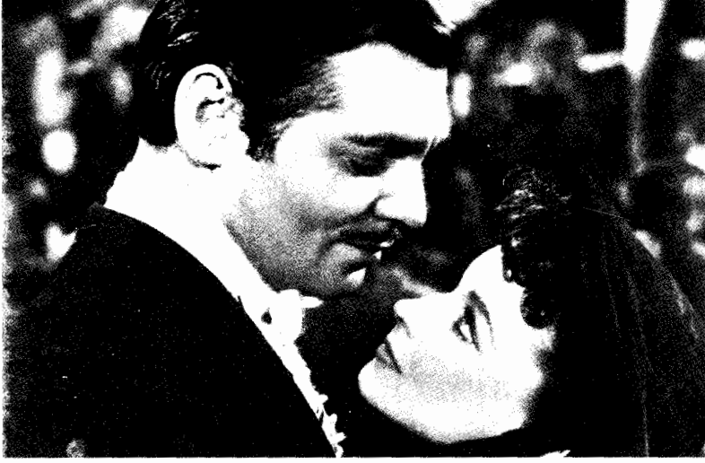
فيلم ذهب مع الريح

تتنفس ، بشرط أن يتم تبسيطها إلى حد أن تصبح مفهومة . ويمكننا أن نقول ، دون أن نخشى أى تضارب ، أن شخصيات سينمائية كثيرة قد فشلت لكونها معقدة جدا أكثر من تلك التي فشلت لكونها بسيطة جدا .