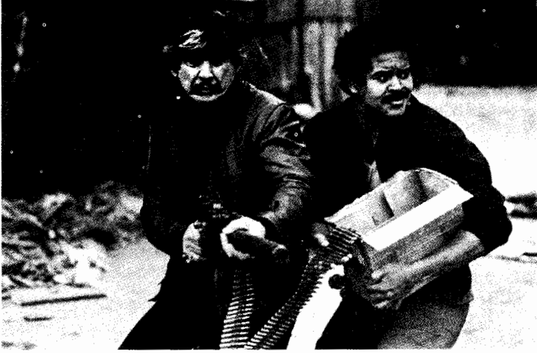
فيلم رغبة الموت

فيلم "بونى وكلايد" فى الدماء لإثبات البطولة الشعبية . ويوضح فيلم "كلاب القش" كيف يمكن للمثقف المطعون فى شرفه أن يصبح أشد فتكا ممن طعنه .