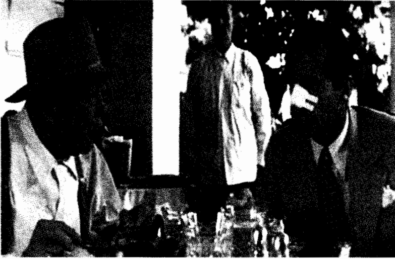
فيلم الخي الصيني

وهكذا تبدأ المواجهة بين الأهداف . أهداف متعارضة تبادلية . وأقصد أن أقول ، أنه إذا حصل الشخص "أ" على ما يريد فلا يمكن للشخص "ب" أن يحصل على ما يريده هو . والمواجهة الناجحة هي التي تجمع ، قبل اى إعتبار ، بين القوتين المشتركتين - أو أكثر - بطريقة تمكنهم من الصراع . ويعنى هذا عادة الملاقاة وجها لوجه . والتنوعات هنا ممكنة - لاحظ الحروب بين المحبين التي تشن من خلال التليفونات . ويعتمد الأمر على الخيال والتصوير ، أى درجة الإبداع التي يصل إليها كاتب السيناريو . و بعد هذا ، يجب أن تقدم المواجهة أهدافا متعارضة تكون أ - محددة وملموسة .