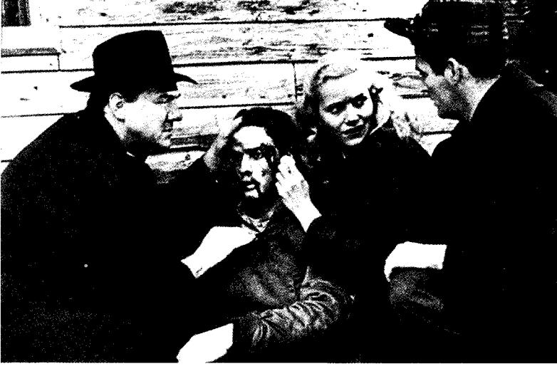
فيلم في الميناء

فرجينيا تعارضا قاطعا مع وجوده الحالي في شيكاغو - ومع ذلك فهو أمر مقبول تماما في ضوء التدفق الكبير لأهل تلك المناطق على مدن وسط الغرب .