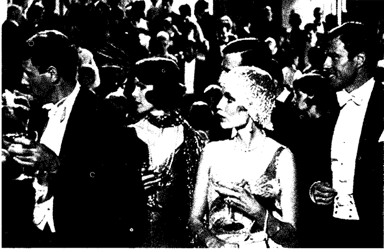
فيلم جاتسبي العظيم

و لتتفيذ هذا، فإنك تربط بين سلسلة من المواجهات التي تتبادل مع سلسلة من الإنتقالات حتى يصل الوقت إلى نهايته، لتحصل على ٩٠ دقيقة من زمن العرض السينمائي . و هناك حقيقة عدة أسئلة يمكنك أن توجهها إلى نفسك قبل أن تبدأ العمل في كتابة أى سيناريو ، وكلها أسوأ من سؤال "هل فكرتى تمنح فرصا جيدة لبناء المواجهات ؟ بمعنى أنه هل يلزم للبطل أن يناضل لكي يصل إلى ما يريد، وهل يمكننى أن أدبر أحداثا للصياغة الدرامية لهذا النضال ؟"