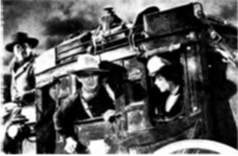
فيلم عربة السفر

و لسوء الحظ ، كثيرا ما يحدث أن يكتب الكاتبون سيناريوهات يجلس فيها أشخاص يتحدثون عن الماضي والحاضر والمستقبل . وما هو أسوأ أنهم يختارون مواضيع لا تمنح فرصة لشيء أن يحدث إلا أقل القليل . ولا تمنح فرصة للقصة لكي تتطور عن طريق أشخاص يفعلون أشياء . لقد تم عمل أفلام جيدة ، وما زال هذا ممكنا ، بأماكن قليلة جدا وحركة محدودة تماما . ولكن لهذا النوع من الأفلام مشاكله الخاصة ، فتأكد أولا من أنك مستعد لمواجهة هذه المشاكل قبل أن تلقى بنفسك في مياه يحيط بها الضباب من كل جانب .