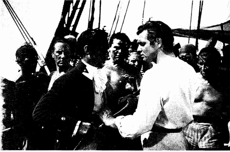
فيلم ثورة علي السفينة بونتي

و كلاهاتين المرحتين من عمل كاتب السيناريو تتطلبان أكبر قدر من المهارة والإبداع . وفي هذا المجال ، وفي تنفيذ هذه المهام الرئيسية من خلال التطبيق المبدع لبعض المبادئ الأساسية ، يستحق كاتب السيناريو ما يتقاضاه من أجر .