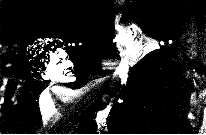
فيلم شارع غروب الشمس

تم هذا بسرعة كلما كان أفضل . لماذا ؟ لكي يكون للبطل شخص أو شيء محدد عليه أن يهزمه ، أو يهزم منه ، عند الذروة ، وأوج الصراع لتحقيق الهدف . لاحظ ريك ضد ستراتر في فيلم " الدار البيضاء " ، ورينجو ضد الإخوة بلامر في فيلم " عربية السفر " ، وجو جيليس ضد نورما ديزموند في فيلم " شارع غروب الشمس " .