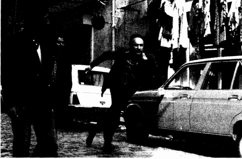
فيلم حلقة الإتصال الفرنسية

الخاليتان من أى حدقة ، والبطله والمشية الغريبة . وبيلاز لها زى الممرضة ، ولويس له شجاعته التى تصل إلى حد التهور . إنى اتفق معك على أن مثل هذه البطاقات ليست ضرورية دائماً . ولكنها فى الوقت نفسه لا تعتبر خاطئة لا تغتفر ، وخاصة عندما يكون التعرف السهل والتميز مطلوباً .