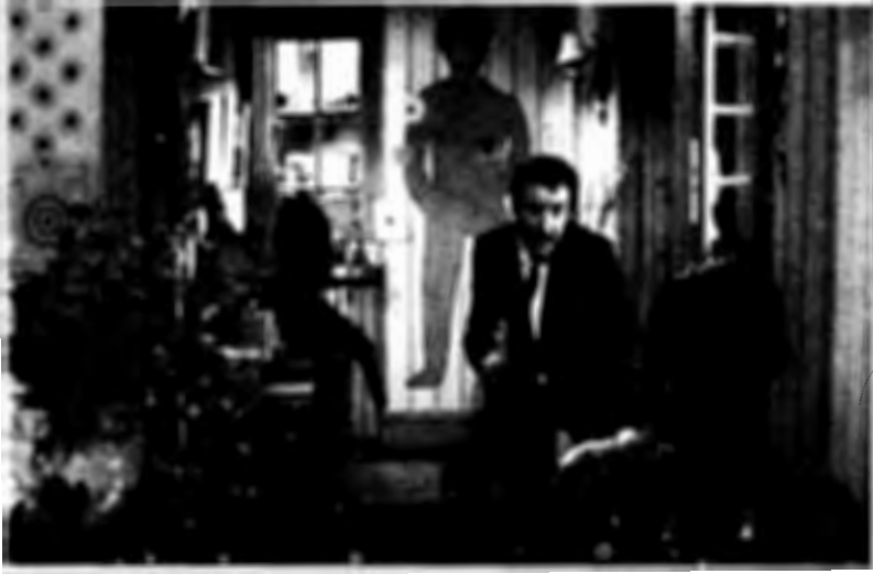
فيلم عودة الفهد الوردي

ويحضرني هنا مثال جيد لهذه النقطة بالذات ، عن قصة رجل تم اغتيال أخيه . ولقد حاول كاتب السيناريو بأقصى طاقته دون أن يصل إلى حل يقدم به الشخصيات الرئيسية - بما فيها المرأة التي قامت بمهمة القتل - مبكرا بقدر كاف .