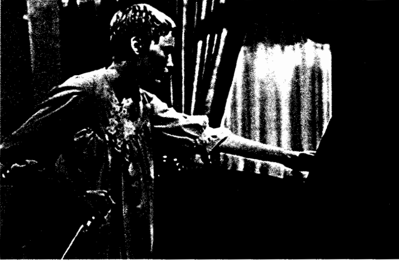
فيلم طفل روز ماري

بسبب وباء يأتي من الفضاء . إن فيلم "الأب الروحي" يستحوذ على مشاعرنا عندما يطلعنا على ما يقلقنا من أعمال رجال المافيا . وفي فيلم "وادي العرائس" نحن لا نرى فقط الإثارة الجنسية، بل نرى أيضا طريقة للحياة تهدد حياتنا نحن، وهكذا تصبح وثيقة الصلة بنا . و لكي يكون للفكرة الأساسية امكانيات درامية فإن هذا يعني أن يتوفر لها احتمال أن تدفع الناس إلى داخل الصراع مجسدا وأن يشترك فيه أشخاص آخرون . فإن كانت جذور القصة التي تمتد إلى صراع داخلي لراهب يركع على ركبته في صومعته، قد تستهوى عددا من المتفرجين، فإن عددا أكبر بكثير يستهويهم الصراع الذي يتشابك فيه رجل مع رجل آخر (أو مع امرأة)، فالصراع موجودا حيثما توجد المعارك بطبيعة الحال، وينطبق هذا على مواقف الغواية أو التلاكم بالأيدي .