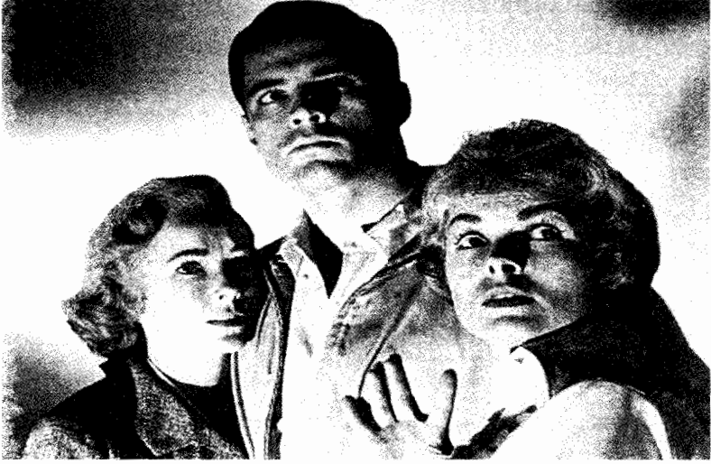
فيلم نفوس معقدة ( سايكو )

وقد يكون التركيز هو المهم عندما نتعرض لمثلا لآلة لإعداد طوايع من نوع معين . قد نخصص لكل خطوة من مراحل تشغيلها جزءا من الثانية ، إلا أن جزءا معيناً من تداخل التروس أو إتصال الأجزاء ببعضها قد تكون له أهمية فائقة . ومادمت قد أدركت هذا من خلال بحوثك ، فأنت تقسم العملية كلها إلى أجزاء ، لتشغل الشاشة بلقطات قريبة جدا قوية مرتبطة بالآلة للتركيز على التفاصيل التي تريد توجيه الانتباه إليها . إن الجزء من الثانية الذي يستغرقه فعلا طبع الطابع قد يمتد ليستغرق دقيقة أو أكثر على الشاشة .