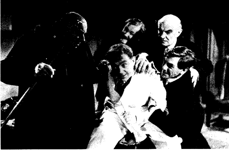
فيلم الرجل ذو البدلة البيضاء